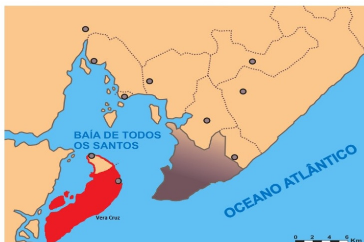
Figura 2: Baía de Todos os Santos com destaque para Vera Cruz (Ba)

O município de Vera Cruz está localizado na Ilha de Itaparica região metropolitana de Salvador, distando da capital a 289 km por via terrestre, e a 15 km via marítima (Figura 1). Possui uma população de 37.567 habitantes (IBGE, 2010) e a atividade pesqueira configura-se como uma das principais fontes econômicas do município. Segundo o Sindicato dos Pescadores e Marisqueiras, são encontradas seis comunidades pesqueiras artesanais no município. As organizações de representatividade da pesca no município são as Colônias de pescadores (Baiacú, Conceição e Cacha Pregos), Associações de Pescadores e o Sindicato dos Pescadores e Marisqueiras.